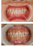
乳歯列反対咬合 症例の治療

必要な場合には、矯正科と連携してマルチブラケット法を小児歯科で行います。さらに、埋伏歯の摘出や牽引症例も、小児歯科単独または口腔外科、矯正科の医局員と連携して、小児歯科診療室で行っています。