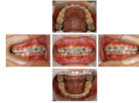
混合歯列期ブラケット装着