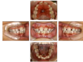
混合歯列期側方拡大治療